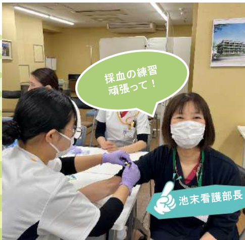
採血の練習 頑張っ！