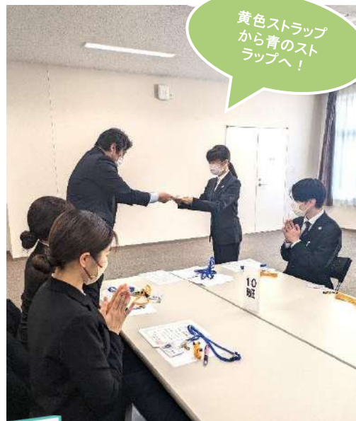
黄色ストラップから青のストラップへ!