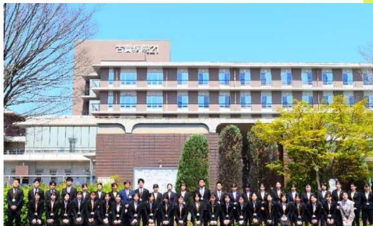
新古賀病院と古賀病院21の2会場をつないだオンライン中継で実施。 新卒看護師さん68名を含め、合計127名が参加されました。